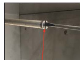
Tightening the End-Caps