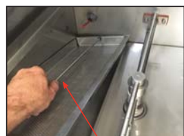
Removing the Strainer