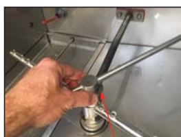
Desatornillar los brazos de lavar y enjuagar