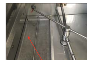
Limpiar el cedazo