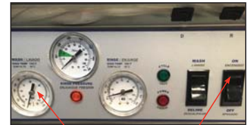
Indicador de la temperatura de lavado Interruptor "ON/OFF"