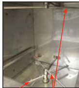
Brazos de lavar y enjuagar