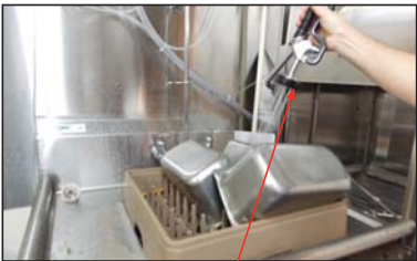
Manguera de pre-enjuague