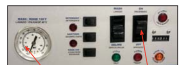
Indicador de la temperatura