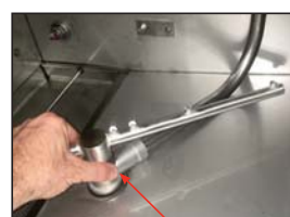
Unscrewing the Wash/Rinse Arms