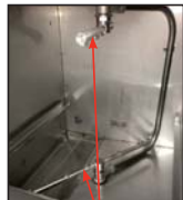
Brazos de lavar/enjuagar