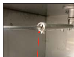
Apretar los tapones de extremo