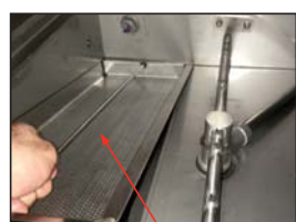
Removing the Strainer