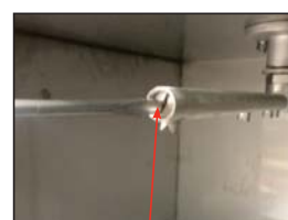
Tightening the End-Caps