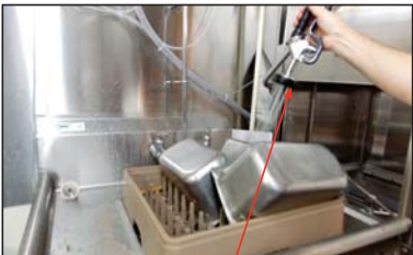
Manguera de pre-enjuague