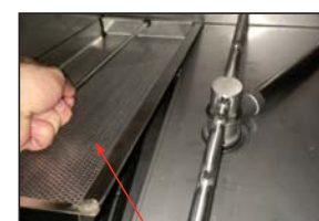
Limpiar el cedazo