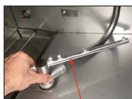
Desatornillar los brazos de lavar/enjuagar